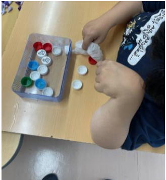
(エコキャップ受領書)